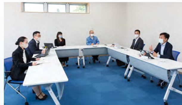
座談会の様子(水戸輸送センター)