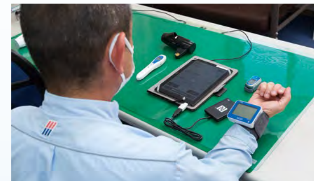
出発前点呼時の測定