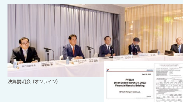
決算説明会(オンライン) 英文資料のタイムリーな開示

当社グループは、証券アナリスト・機関投資家等を対象とした決算説明会・電話会議・スモールミーティング、海外ロードショー、個別面談等での対話を通じて、コミュニケーションの充実を図っています。2021年度は、新型コロナウイルス感染拡大を踏まえ、株主を含む投資家との個別面談や決算説明会、スモールミーティング等はオンラインで実施したほか、英文資料のタイムリーな開示を行い、株主・投資家との対話の促進に取り組みました。