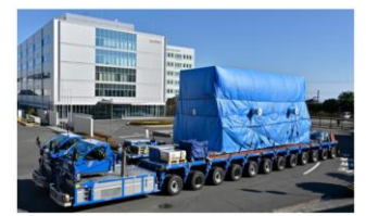
宇徳の「スーパーキャリア」