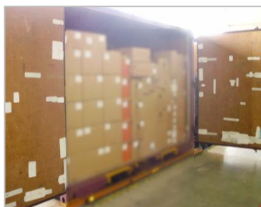
▲製品荷姿 (札幌市向け)