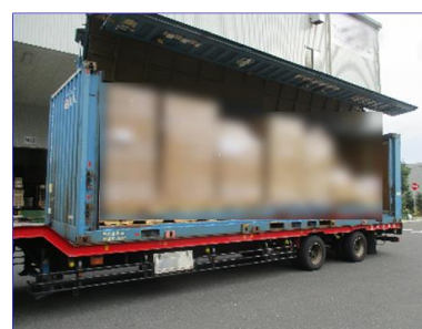
▲製品荷姿 (大阪市向け)