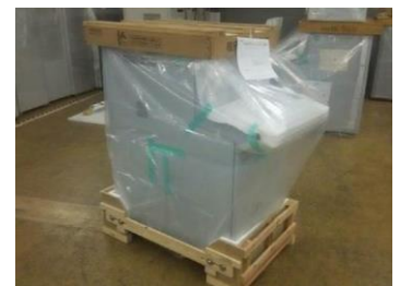
▲鉄道輸送専用パレット