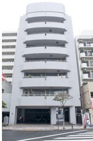
△矢吹海運 本社ビル

今後も当社グループは、協創パートナーとの連携を強化し、安全で高品質な物流サービスの追求に努め、グローバルサプライチェーンにおいて最も選ばれるソリューションプロバイダをめざしてまいります。