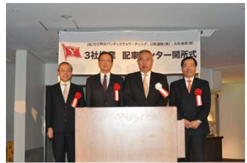
△開所式 ※2 の様子