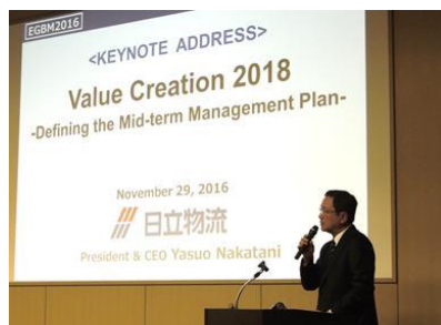
▲弊社中谷社長によるスピーチ