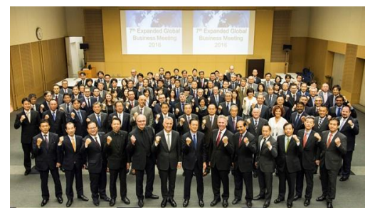
▲出席者全員での記念撮影

【お問い合わせ先】 ㈱日立物流 経営戦略本部 広報部 TEL:03-5634-0357